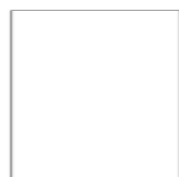
60,3x60,3 . 24"x24"