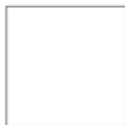
60x60 . 24"x24" RETTIFICATO