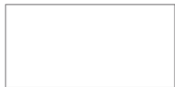
60x120 . 24"x48" RETTIFICATO