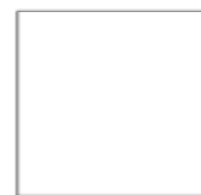
60x60 . 24"x24" RETTIFICATO