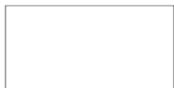
60x120 . 24"x48" RETTIFICATO