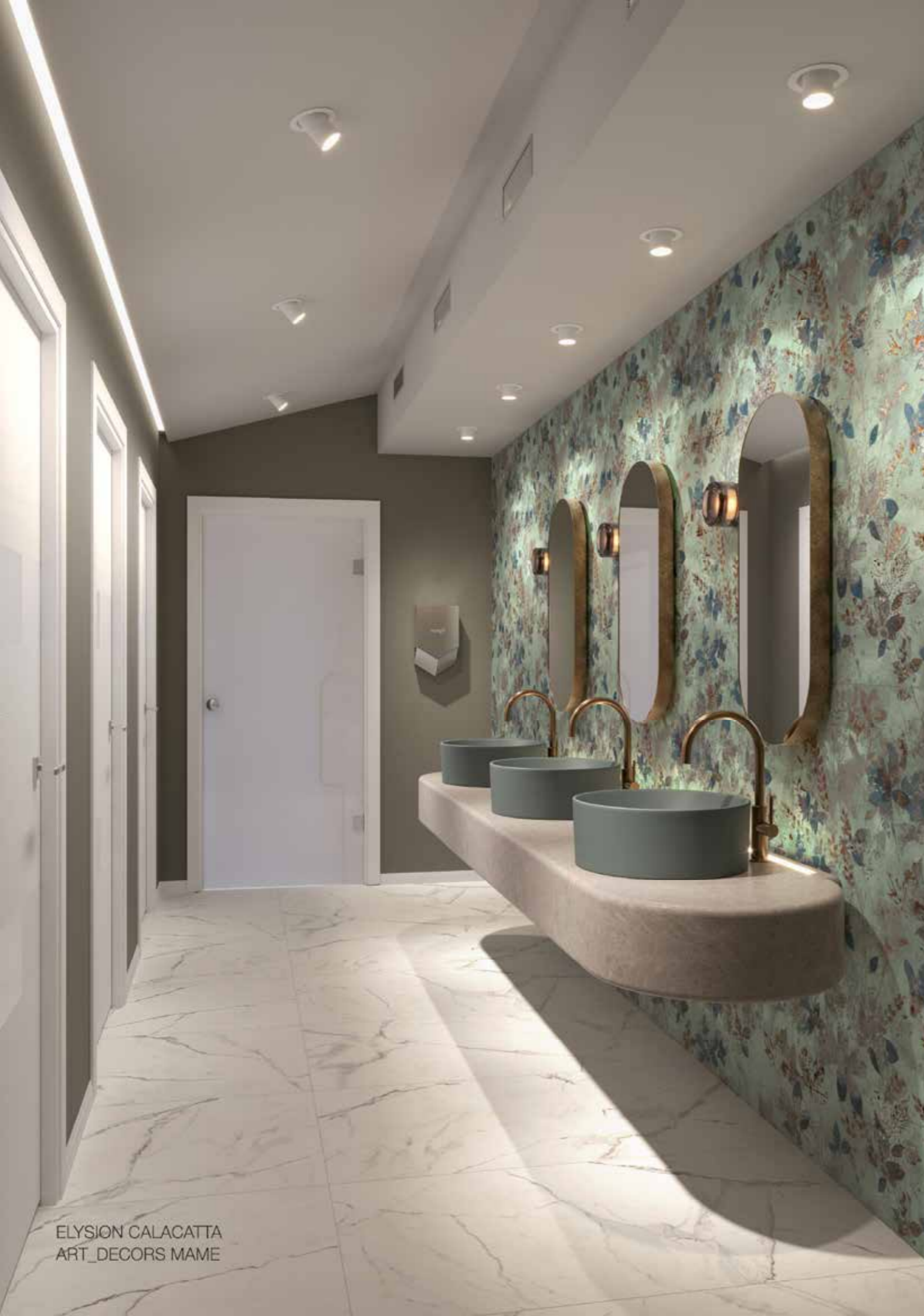
ELYSION CALACATTA ART_DECORS MAME