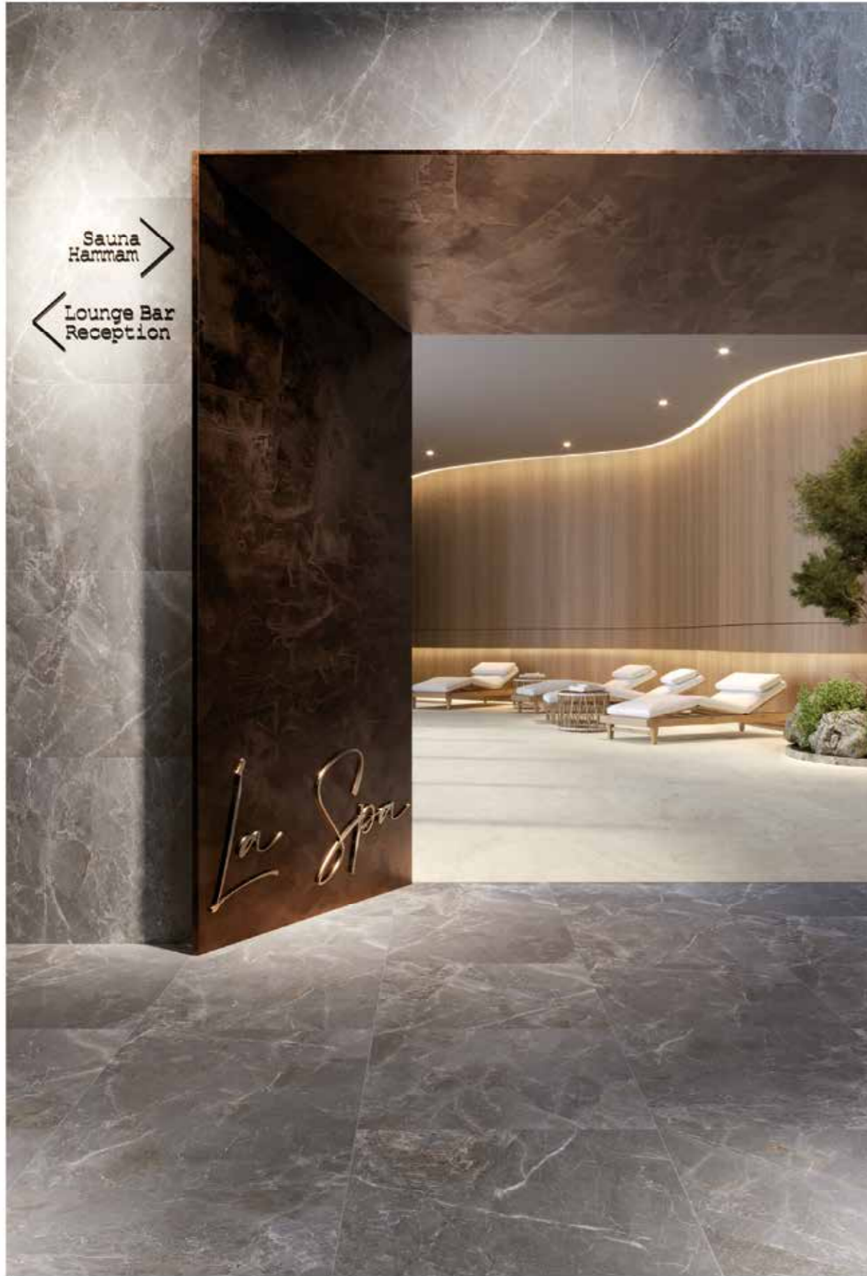
ELYSION DARK ELYSION TRAVERTINO